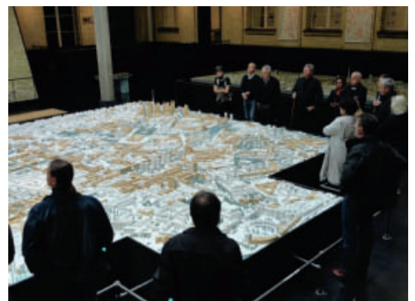
Stadtmodell von Berlin ausgestellt in der Senatsverwaltung für Stadtentwicklung