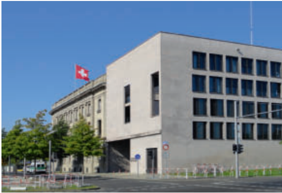
Die Schweizer Botschaft mit ihrem Betonzubau aus nur einem Guss von Diener und Diener

Botschaft. Das Spektakuläre daran: Der Betonzubau ist aus einem Guss – eine Herausforderung für den Schalungsbau, eine Idee der Architekten Diener und Diener.