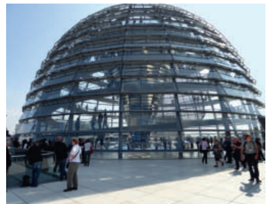
Der Reichstag mit der Kuppel von Norman Foster