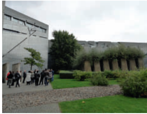
Das Jüdische Museum Berlin von Daniel Libeskind