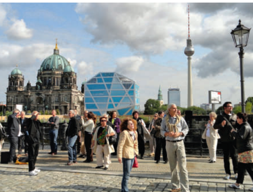
Die Reisegruppe vor dem Berliner Dom

Bauten aus Beton zu suchen, war nicht notwendig, denn Sichtbeton ist in Berlin absolut in. Gleich gegenüber dem Reichstag fällt ein eigentlich unspektakulärer Bau auf – alte, deutsche Architektur mit einem flotten Anbau, die Schweizer