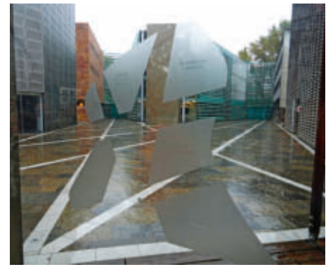
Die nordischen Botschaften nach einem Masterplan von Berger und Parkkinen

das nicht die Wohnungen der armen Leute waren – wie oft gedacht wird. Viele der riesigen „Wohnmaschinerien“, wie Krüger sie nennt, sind bereits saniert – viele andere warten noch darauf. Immer noch blitzen neben schmuck renovierten Gebäuden kaputte und leer stehende Bauten durch. Das Geschäft mit Bürobauten liegt zurzeit brach, der Wohnungsbau boomt. Grundsätzlich gilt derzeit die Regel, bei allen Projekten müssen mindestens 20 Prozent Wohnbau dabei sein. Neben den sanierten Wohnbauten wie z. B. der Großsiedlung Siemensstadt oder der Großsiedlung Britz – beide haben Weltkulturerbestatus – wurden auch für die verdichteten Teile und die betuchteren Liebhaber der Stadt Lösungen gefunden: die Townhouses. Extrem schmale Einfamilienhäuser, die aber über drei Stockwerke reichen. Das Besondere: Jedes Haus hat eine eigene, selbstbe-