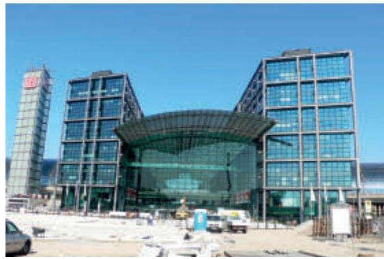
Der neue Hauptbahnhof von Gerkan, Marg und Partner – über 300.000 Menschen passieren den Knotenpunkt jeden Tag