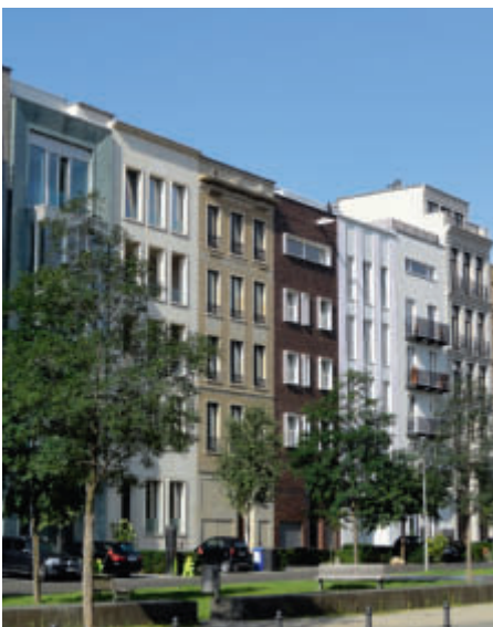
Townhouses – ein teures Stadtentwicklungsprojekt diverser Architekten

Berlin ist lebendig, denn trotz des Masterplans ist in der Stadtentwicklung nichts fix. Die Projekte der kommenden Jahre sind die Hochhäuser am Zoo und am Alexanderplatz, die Staatsoper, die Revitalisierung des Congress Centrums Berlin. Am ehemaligen Hamburger Bahnhof entsteht zurzeit die Euro-City – ein Stadtquartier mit über 40 Hektar. Falls keine Investoren – wie vor Jahren Sony für den Potsdamer Platz – Schlange stehen, werden welche gesucht.