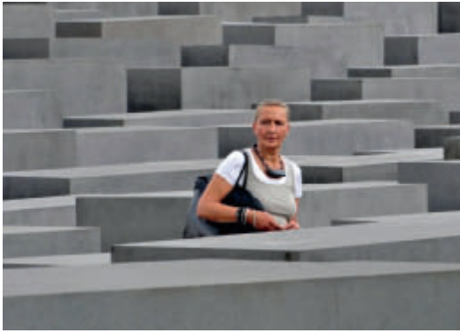
Das Mahnmal der ermordeten Juden Europas von Peter Eisenman (im Bild die Autorin)