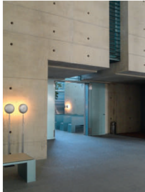
Das neue Krematorium der Architekten Schultes Frank

Anderes Vorzeigebispiel: Das neue Krematorium der Architekten Schultes Frank. 29 Schleuderbetonstützen mit Lichteinlass von oben in tragender Funktion, obwohl sie nur an einer Stelle mit der Decke verbunden sind. Sichtbetonwände mit perfekt geschalteten Nähten, kombiniert mit dem dezenten 60er-Jahre-Porschegrün für Einrichtung und Details, sind inzwischen das Erkennungsmerkmal der deutschen Architekten, die auch für das neue Bundeskanzleramt verantwortlich zeichnen. Spannendes