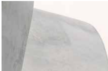
Die Planung und die Ausführung der Primärkonstruktion erfordern hochpräzises 3-D-Modellieren und Fertigen