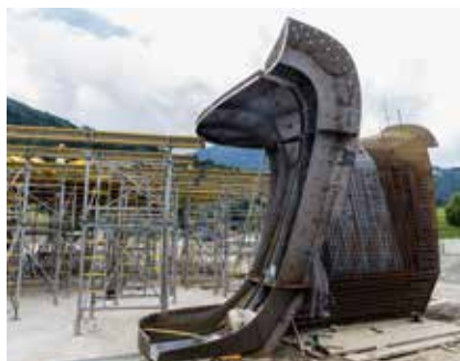
Die Stahlschalung einer der Stützenfüße, die auch als Schablone für den Spritzbeton dient