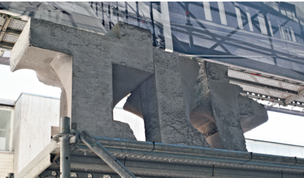
Installation CONCRETION, Biennale Venedig 2010