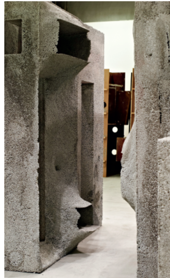
Installation A STYROFOAM LOVER WITH (E)MOTIONS OF CONCRETE, SCI-Arc, Los Angeles 2009

Und während das Konzept in Zukunft produktionstechnisch weiterverfeinert werden soll, um auch den Sprung zur „Marktfähigkeit“ zu schaffen, haben die in Guntramsdorf gefertigten Prototypen in den Giardini della Biennale ihre Schuldigkeit bereits getan. Gegen den Rücktransport nach Ende der am 21. November ausgelaufenen Architekturausstellung sprachen drei gewichtige, je 300 Kilogramm schwere Gründe.