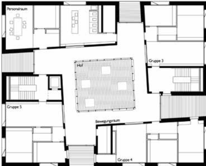
Grundriss 1. Obergeschoß