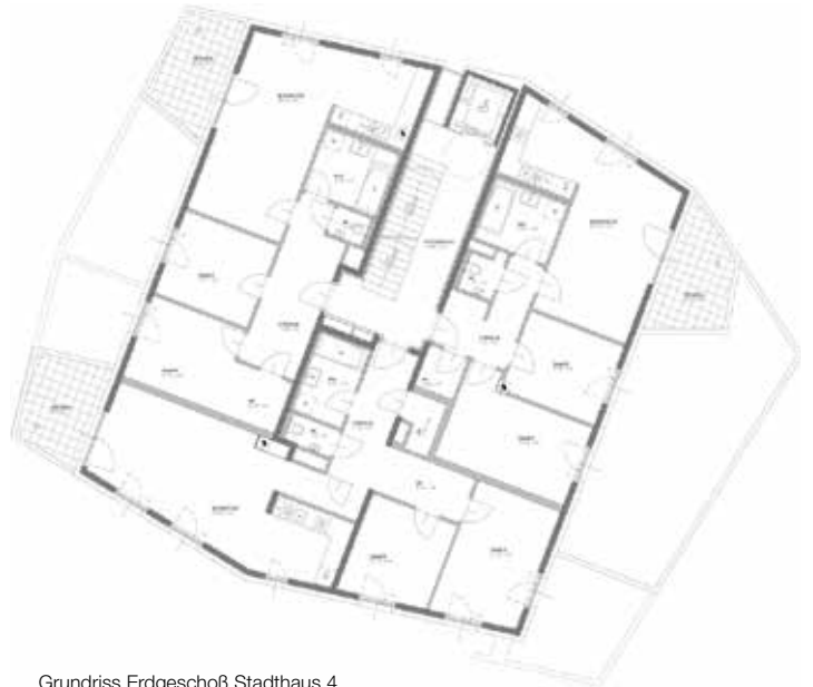
Grundriss Erdgeschoß Stadthaus 4