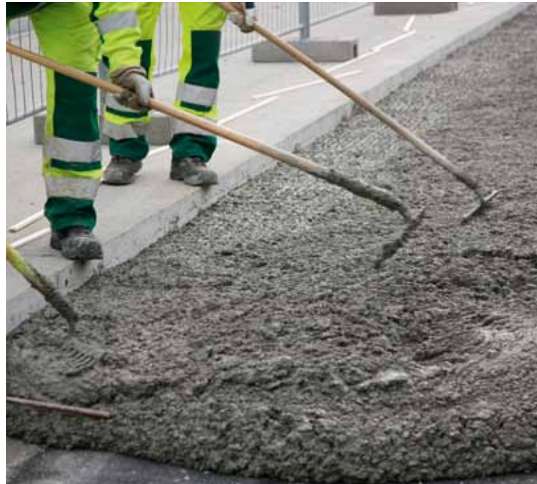
Der Einbau der neuen Betonfelder ist Präzisionsarbeit