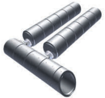
3-D-Skizze: Das Speichervolumen des Trinkwasserspeichers in Zagling beträgt 150 m 3 .

Etwas mehr als ein Jahr ist es inzwischen her, dass der Trinkwasserspeicher eingebaut wurde, vor gut zwei Jahren begannen die ersten Planungen. Die damals existierende Trinkwasserspeicherung bei Zagling war inzwischen 40 Jahre alt, zudem mit einem Fassungsvermögen von etwa 35 m 3 nicht mehr adäquat, um den neuen Anforderungen und Bedürfnissen der Genossenschaft gerecht zu werden. Daher entschied man sich für eine neue Lösung. Im März 2012 waren die Planungen abgeschlossen