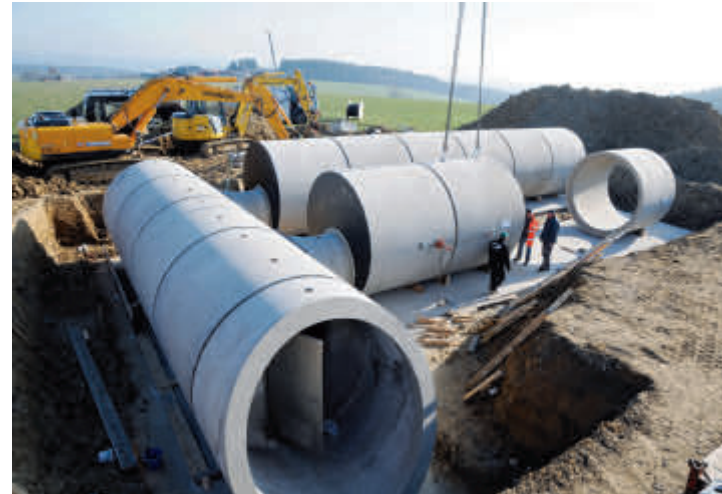
Nach der Verlegung der Rohre wurde die Schieberkammer mit entsprechender Technik ausgestattet.