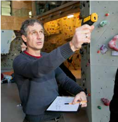
Prüfungen der Oberflächentemperaturen der Wände und des Bodens bestätigen die gleichmäßige Temperaturverteilung in der Halle.