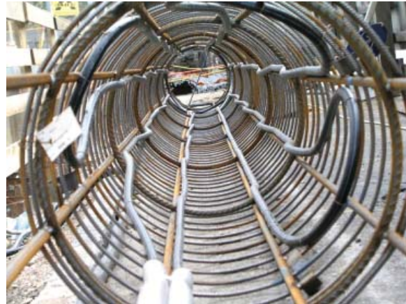
Belegung eines Energiepfahles mit den Leitungen

Für die Heizung und Kühlung wird dafür die Energie mit Tiefsonden (46 Stk. à 150 m = 6.900 lfm) und den Fundamentpfählen (90 Stk. à 10 m tief = 900 lfm) aus der Erde bezogen. Damit können im Durchschnitt 50 Watt/lfm ge-