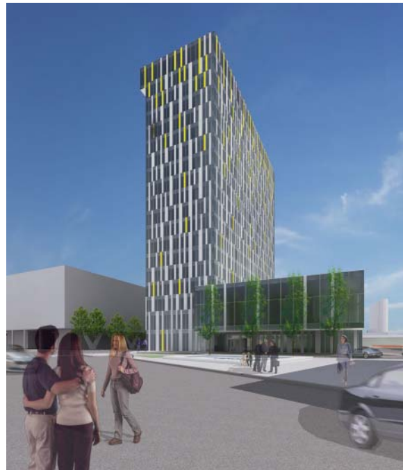
Ansicht Power Tower

Mit dem derzeit im Rohbau befindlichen Power Tower, der neuen Konzernzentrale in Linz, läutet die Energie AG Oberösterreich ein neues Zeitalter in Sachen Energieeffizienz von Büro-Großbauten ein. Der Power Tower wird das weltweit erste Bürohochhaus sein, das mit Passivhauscharakter errichtet wird. Die neue Konzernzentrale wird ressourcenschonend auf den Einsatz von fossilen Energieträgern für Heizung und Kühlung verzichten können. Energie wird aus der Erde und dem Grundwasser gewonnen bzw. mit einem 700 m 2 großen Sonnenkraftwerk an der Fassade erzeugt. Damit setzt die Energie AG einen bisher beispiellosen Meilenstein bei der Umsetzung ihrer Energieeffizienz- und Nachhaltigkeitsphilosophie.