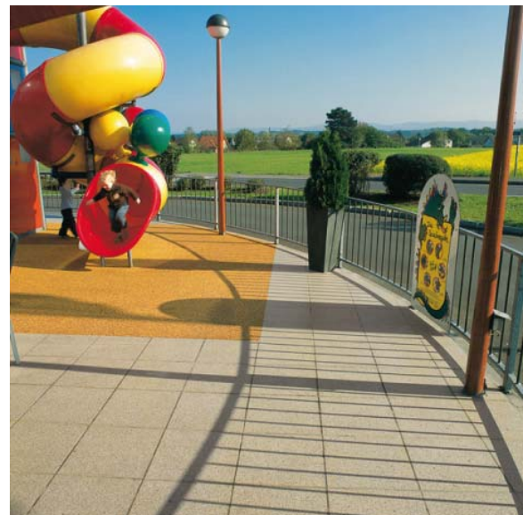
Abb. 6: Semmelrock Carat Exklusiv Caramelo; McDonald's, Amstetten