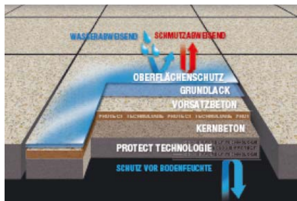
Abb. 4: Systemaufbau Semmelrock Premium Protect