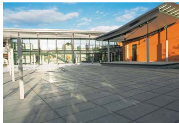
Abb. 5: Semmelrock DUOMO grau; Gemeindeamt Launsdorf

Die Abb. 5 und 6 zeigen verlegte Flächen mit Semmelrock Premium Protect.