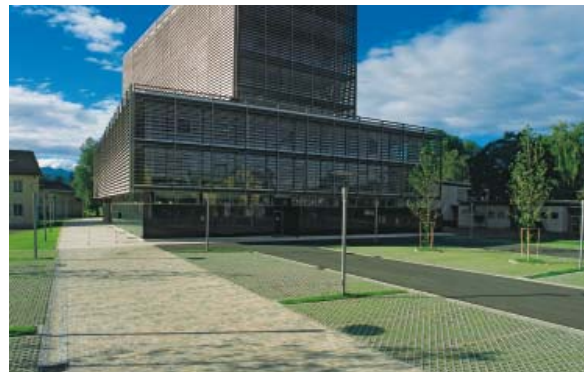
Abb. 3: Semmelrock Appia Antica lava-grau meliè; Bezirksgericht Klagenfurt