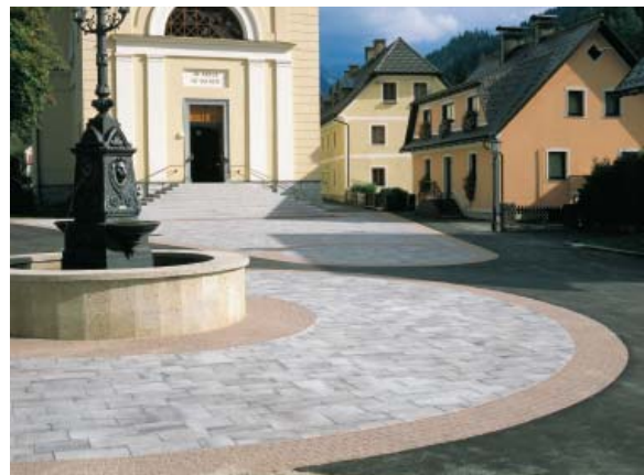
Abb. 2: Semmelrock Umbriano granitgrau-weiß; Kirchenplatz, Gusswerk

Die Abb. 2 und 3 zeigen verlegte Flächen mit Semmelrock Protect.