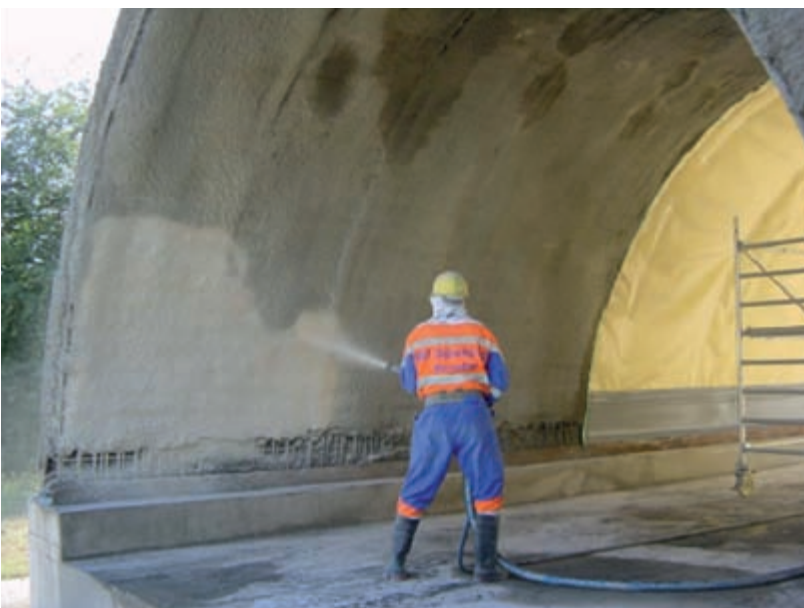
Abbildung 1: Spritzversuche an der MFPA Leipzig an einem Versuchsstollen

Das Folgeprojekt befasst sich nun mit der Anwendung von Stärkeethern als Rückprallminderer im Nassspritzbeton und wurde mit Juni 2009 gestartet. Als Partner konnten für dieses Projekt einige hervorragende Firmen und Institutionen gewonnen werden. Das Fraunhofer Institut für angewandte Polymerforschung in Golm wird einen wichtigen