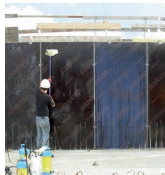
Bild 3: Vorbereitung der Schalung, Trennmittelauftrag